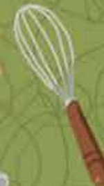
Varillas para remover