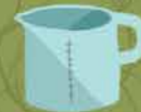
Vaso para medir líquidos