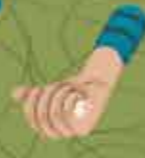
Puñado 10 g