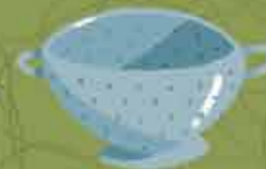
Colador para escurrir