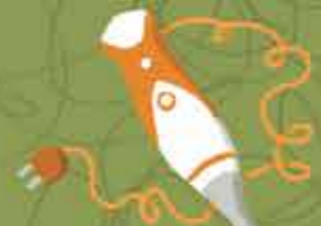
Batidora para batir