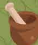
Mortero para machacar