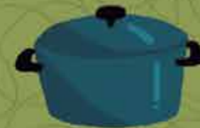
Cazuela para guisar