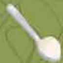
Cucharada 15 ml/g