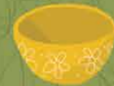
Bol para contener alimentos