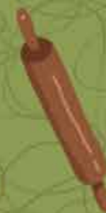
Rodillo para estirar