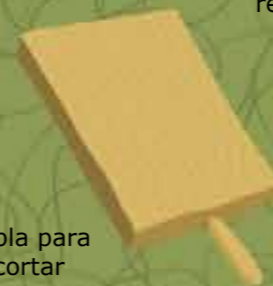
Tabla para cortar