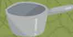
Cazo para hervir