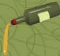
Chorrito 125 ml