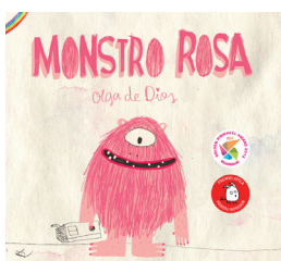
Olga de Dios. 2013