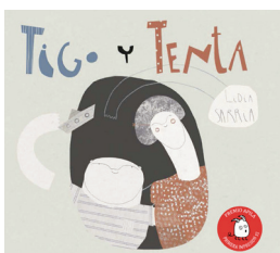
Lidia Sarria. 2015