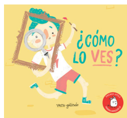
Vera Galindo, 2020