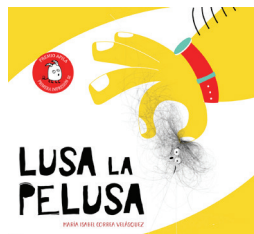
Isabel Correa Velásquez. 2018